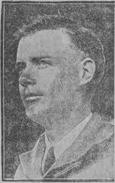
Kpt. Karol Lindbergh.

NOWY JORK, 16 grudnia. (Telegram wł. „Głosu Polskiego”) — Ludność miasta Meksyku, gdzie wylądował onegdaj Lindberg zgotowała bohaterstwu lotnikowi niezwykle entuzjastyczne przyjęcie. Zaledwie aeroplan wylądował, a już tysiące widzów przewało łańcuch utworzony przez funkcjonariuszów policji i zaniósł na ramionach Lindberga do auta posła amerykańskiego Morrow'a.