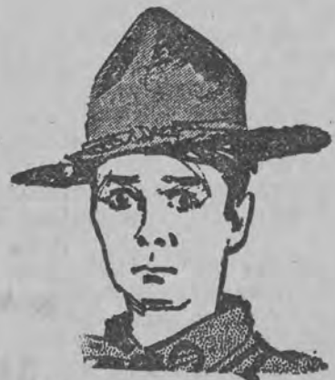
GEORGE K ARTHUR

Na tegorocznym konkursie filmów uzyskała „Parada Rekrutów“ pierwszą nagrodę.