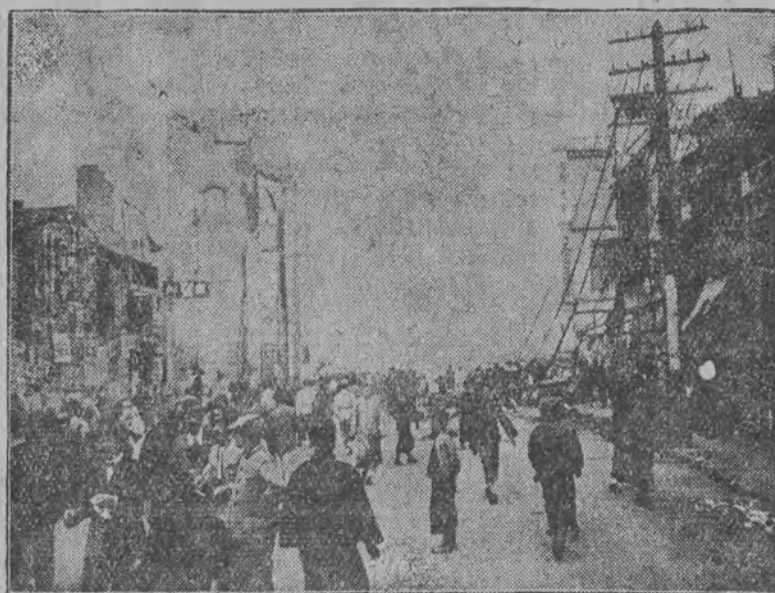
Widok na jedną z ulic Kantonu.