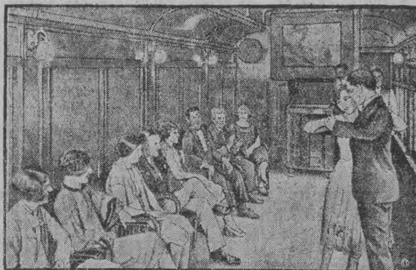
Wagon dancin'owy w pociągu.