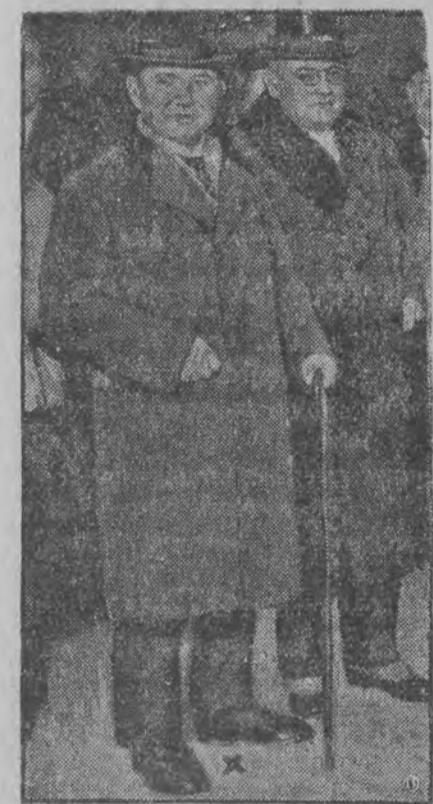
Premjer litewski Waldemaras udaje się na konferencję z ministrem spraw zagranicznych Rzeszy, Stresemannem.