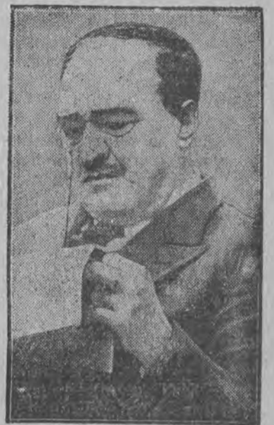
Blasco Ibanez na jednej z ostatnich fotografii.