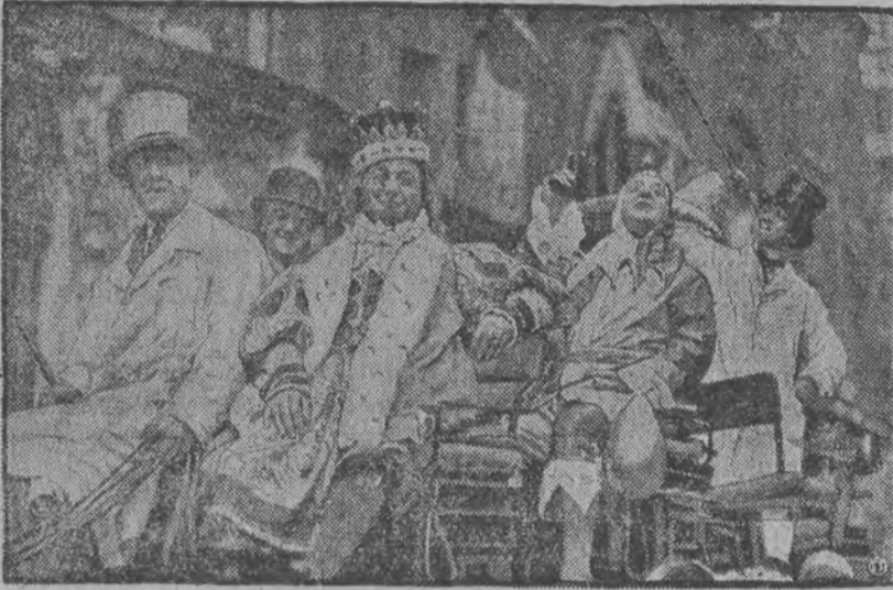
Tak wyglądał tegoroczny król nicejskiego karnawału!

Telefony „Głosu Polskiego“ — Redakcja dzienna 19-71 nocna redakcja i drukarnia od godz. 9 wiecz. 7-99 administracja i ekspedycja 1-99