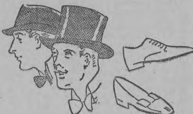
Głowa i nogi eleganckiego gentlemana.