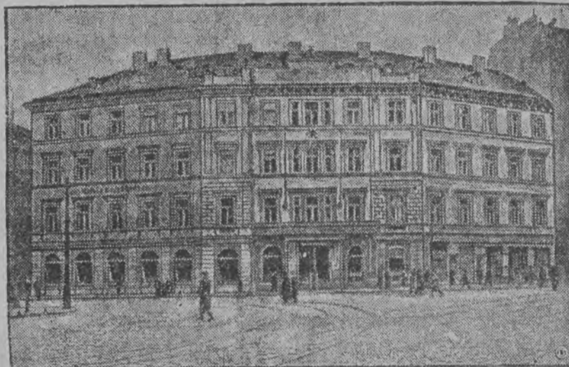
Historyczny budynek, w którym podpisany został w 1866 roku traktat pokojowy po wojnie austriacko-pruskiej, zostanie obecnie zburzony.