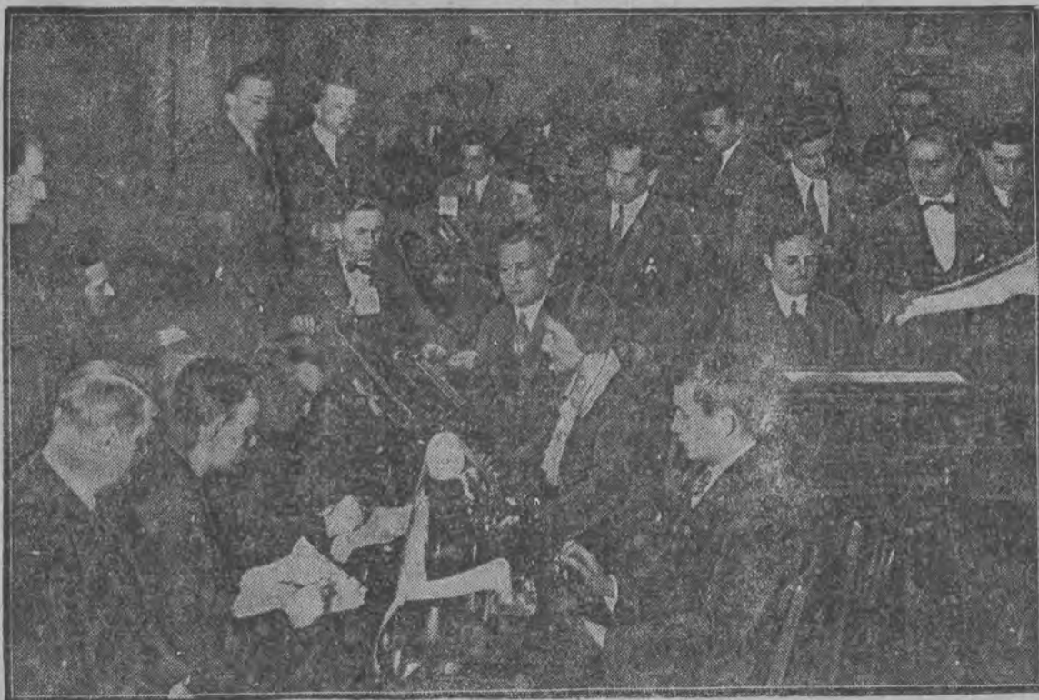
W momencie najintensywniejszej pracy przy obliczaniu wyniku głosowania w Warszawie.