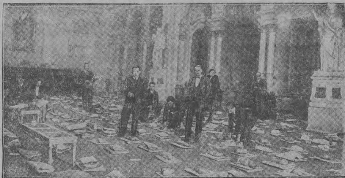
Sala posiedzeń rady miejskiej, zastana aktami głosowania, uporządkowanymi według obwodów Warszawy w nocy z 4 na 5 marca.