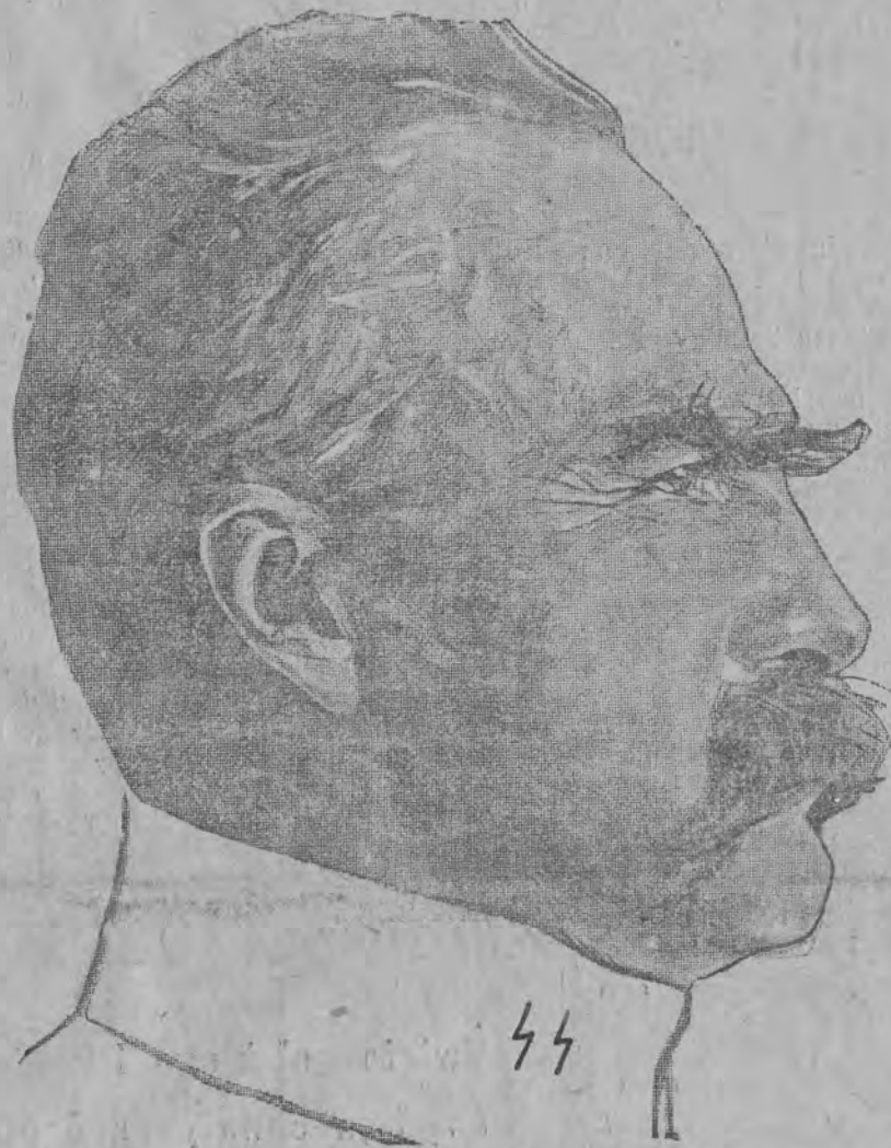
Premjer marszałek Piłsudski.

Już w godzinach przedpołudniowych nadciągają zaczęły do Belwederu delegacje z różnych dziel-