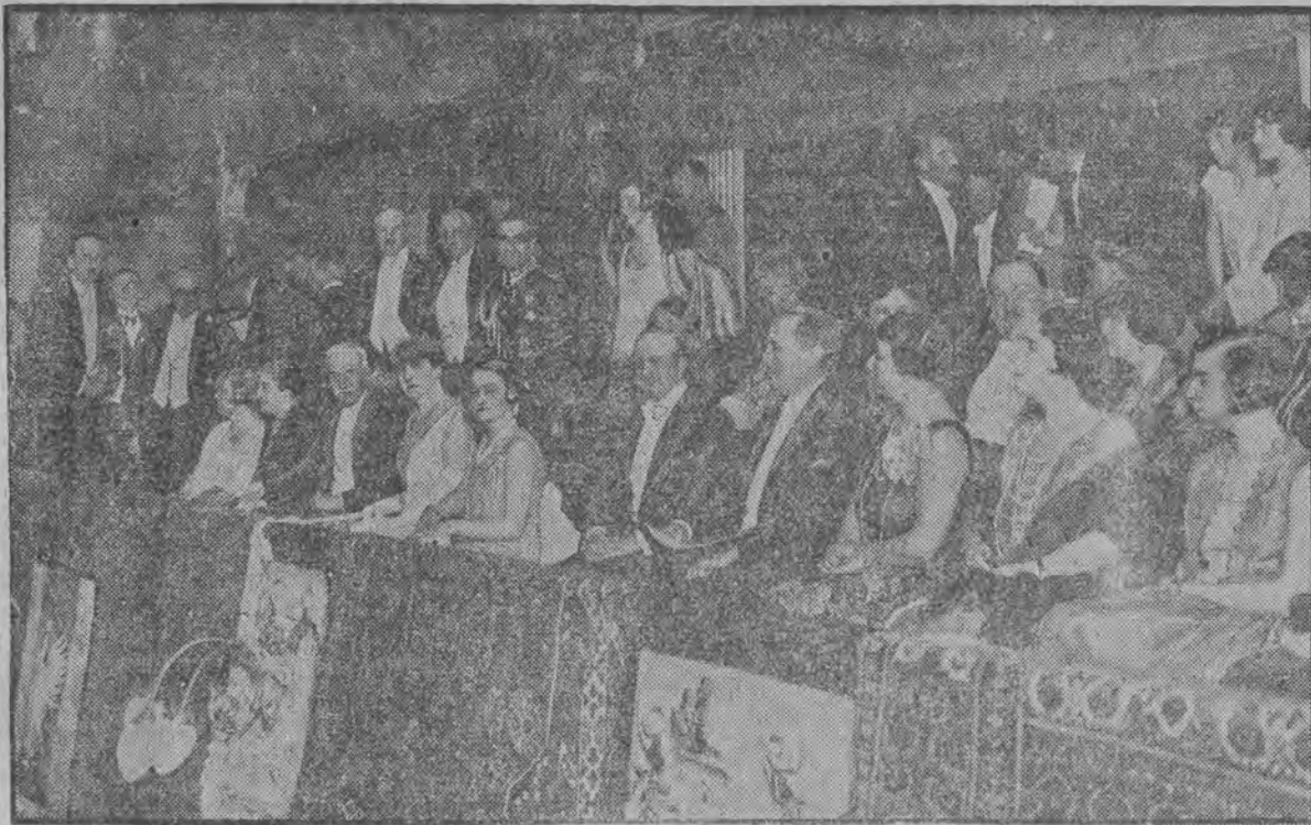
Prezydent Rzplitej w towarzystwie marsz. Pilsudskiej oraz przedstawiciele rządu i dyplomacji.