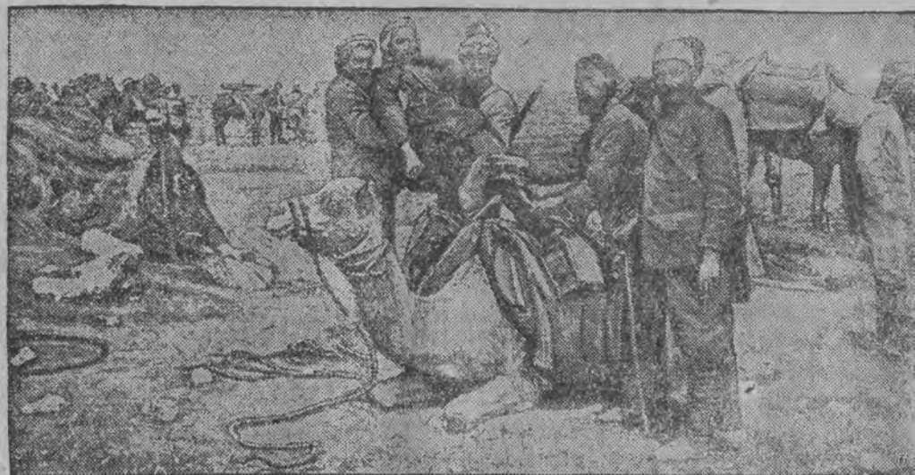
Zdjęcie z terenu walk. Widać na nim oddział powstańców wahha bickich. Oddział ten posiada nowoczesne umundurowanie i uzbrojenie i w niczym nie przypomina dawnych malowniczych wojowników arabskich.