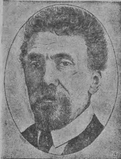
Graf Ulrich von Brockdorff-Rantzau, poseł niemiecki w Moskwie. Rykow, przewodniczący sowieckiej rady komisarzy ludowych