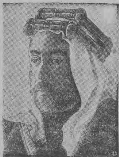
Król Abdullah z Transjordanii, przeciw któremu skierowana jest akcja wojenna wahhabitów.