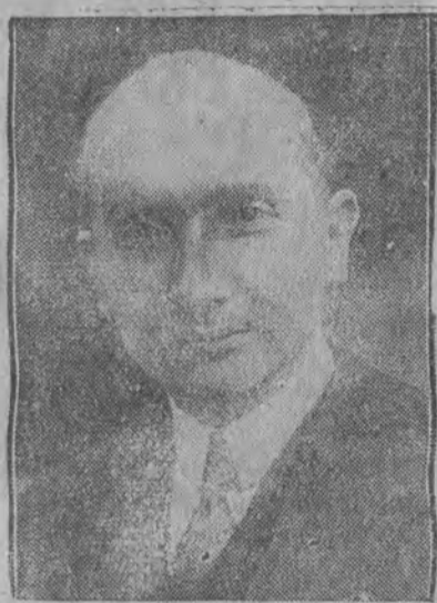
Prezes delegacji polskiej minister Zaleski

istnieje, lecz należy go tylko legalizować. Pan Waldemarasa kwestjonuje promienie 30 klm. w granicach których ruch graniczny ma być otwarty. Delegacja polska oświadcza, iż jest to kwestja do dyskusji. Po tych wyczerpujących wywodach ministra Zaleskiego konferencja została przerwana do godziny 5,30 po poł.