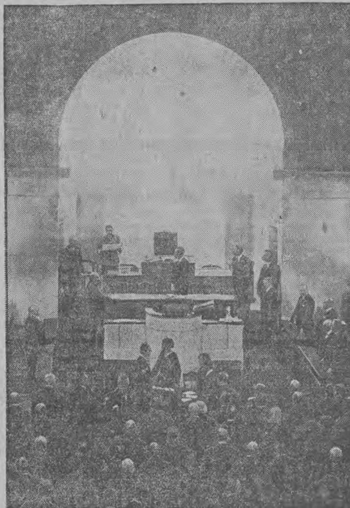
Moment odczytywania orędzia prezydenta Rzplitej przez marsz. Józefa Piłsudskiego izbie senackiej, mieszczącej się obecnie w starym gmachu sejmowym.