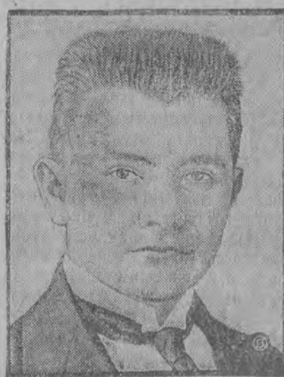
Prezes delegacji litewskiej premier Waldemarasa

KRÓLEWIEC 2.4 (Ate) Dzisiaj o godz. 10-ej rano delegacja polska wręczyła delegacji litewskiej polski projekt paktu o nieagresji oraz propozycje wysłania do Warszawy przedstawiciela dyplomatycznego