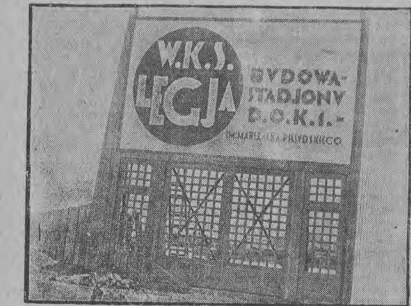
Brama wejściowa stadionu W. K. S. Legja.

Na zdjęciu naszym widzimy piękny moment gry w „rugby” między dwiema drużynami w Paryżu.