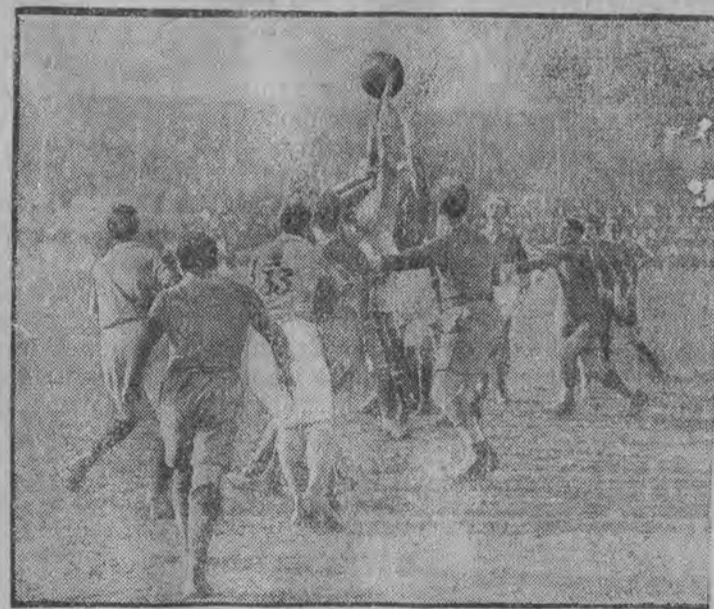
Walka o piłkę między drużynami Paryża.

Gra w piłkę owalną, zwaną popularnie „rugby”, jest sportem niezwykle popularnym specjalnie we Francji, nie mniejszem powodzeniem cieszy się i w Ameryce. Jeśli chodzi o Polskę, to ten pelen temperamentu sport jest