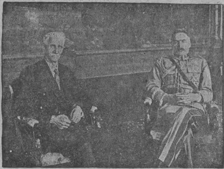
Marszałek Piłsudski, jak już donosiliśmy przed kilku dniami, rewizytował marszałka sejmu, p. Daszyńskiego

Wywiad z marszałkiem sejmu p. Ignacym Daszyńskim