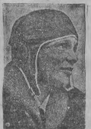
Lotniczka Earhart, jest pierwszą kobietą, która zwyciężyła przez stworza nad Atlantykem.