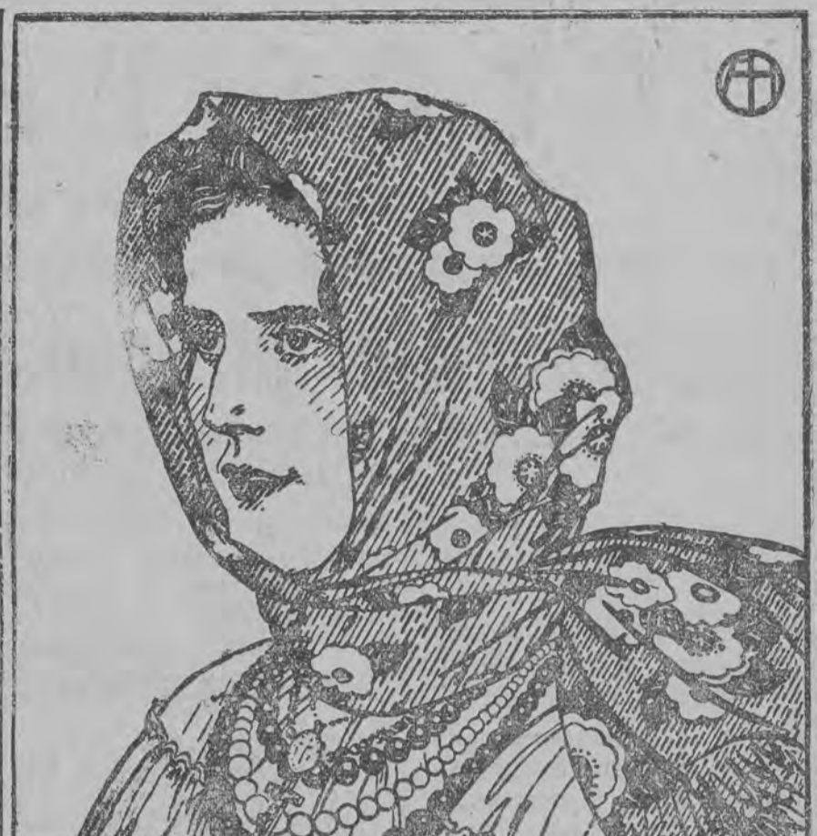
Rusinka z pod Kołomyi powiada: