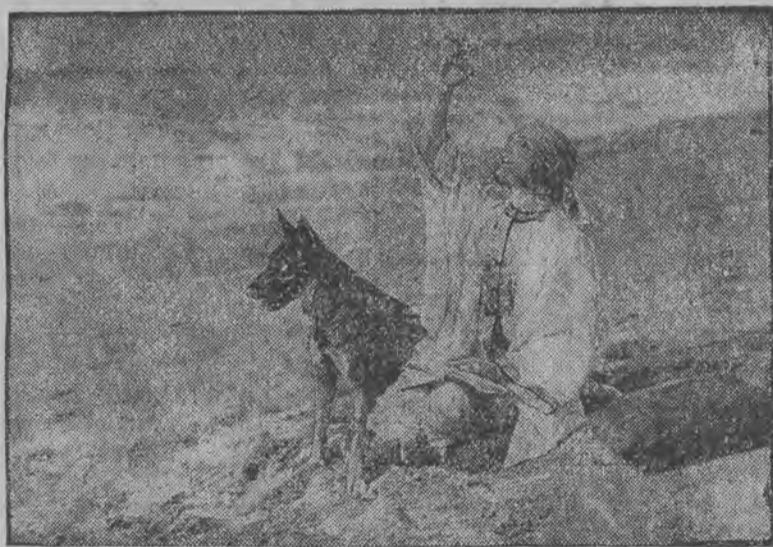
Na wybrzeżu jednego z kąpielisk we Francji, ogólna uwagę zwraca polska gwiazda filmowa, Pola Negri, przebywająca stale w towarzystwie swego ulubionego psa.

Srodek światowej sławy! Ziola moczopędne „The Vichy“ Są najlepszym środkiem przeciw chorobom nerek, pęcherza gonorrhoei i td.