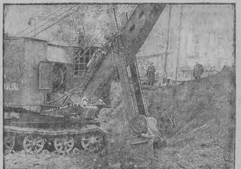
Kopaczka mechaniczna przy pracy na rogu Al. Jerozolimskich i Nowego Świata.