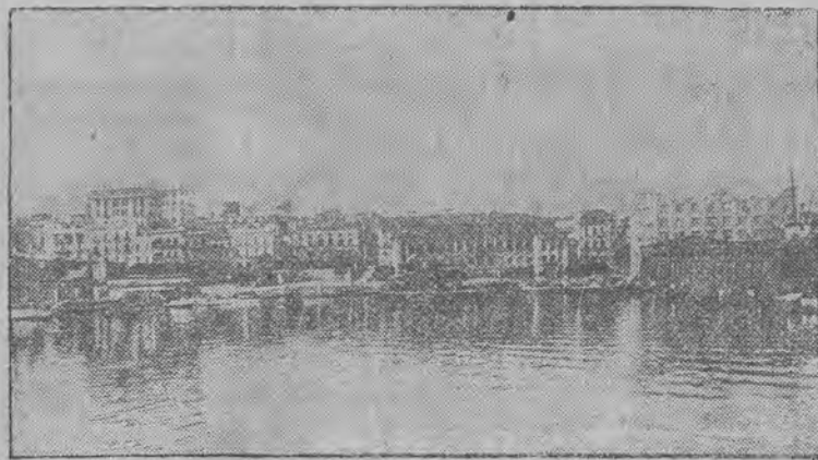
Port w San Juan na Portorico, który wraz z pięknym nowoczesnym miastem, najwięcej poniósł strat w ludziach i budowlach wskutek orkanu.

LONDYN, 21 września. (ATE.) W tych rejonach półwyspu Florydy, gdzie przeszedł huragan ogłoszono stan oblężenia. Władze zmuszone były do tego, ponieważ bandy murzynów zgłodniałych na padają na farmy i posterunki sanitarne.