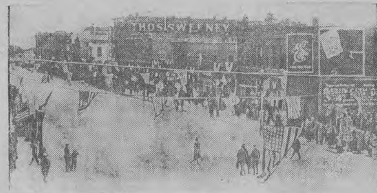
Ilustracja nasza przedstawia główną ulicę w mieście Ford w stanie Illinois, w którym na skutek niezwykłego orkanu większość domów runęła. Dotychczas zdolano tam z pod gruzów wydobyć przeszło 100 zabitych.

Całe szczęście, że orkan, posuwający się coraz bardziej ku północy, znacznie osłabł. Jest obawa, że na dalszej linii poczyna on również spustoszenia, gdyż promienie jego ogarnęły w ciągu srody całe wybrzeże Atlantyku aż po Boston.