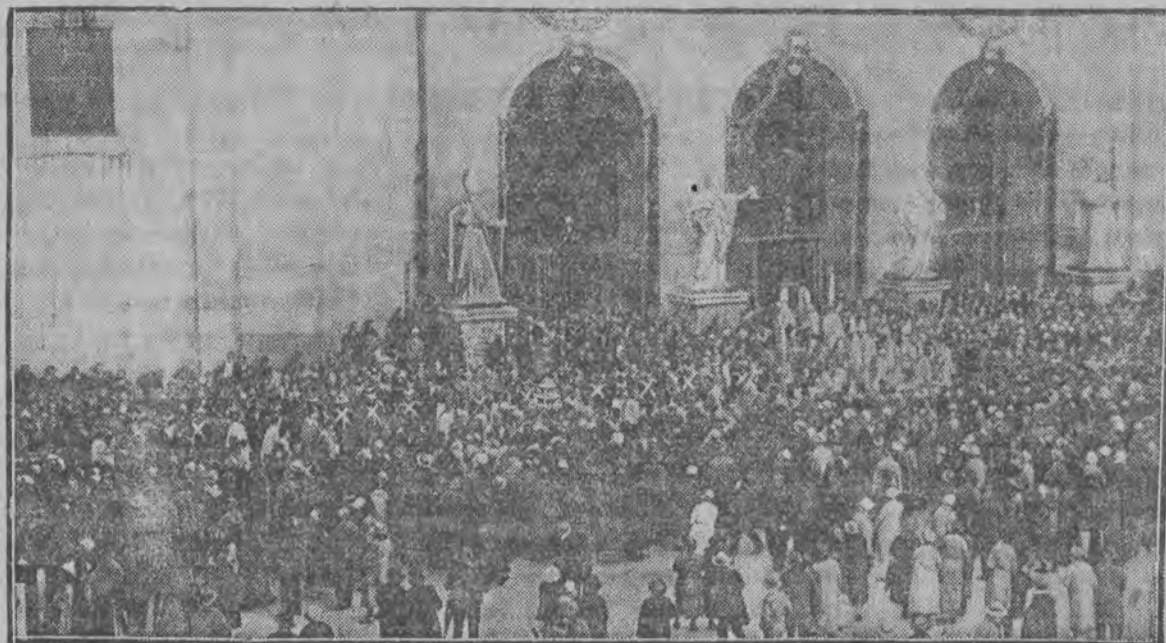
Onegdaj słynna katedra w Salzburgu obchodziła jubileusz 300-letniego istnienia, uroczony niezwykle uroczyscie przez duchowieństwo przybyłe z całej Austrii i Niemiec. Na ilustracji naszej widzimy właśnie procesję, gdy z przybyłymi biskupami udaje się do katedry.