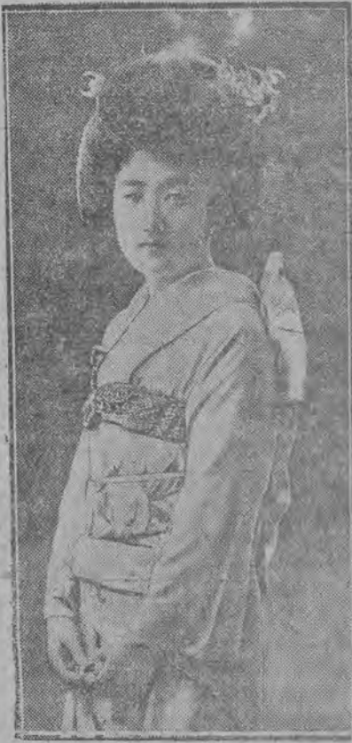
W dniu dzisiejszym odbyły się w Tokio zaślubiny następcy tronu japońskiego, księcia Sziszibu z panną Setsu Matsudaira córką ambasadora Japonji w Waszyngtonie.