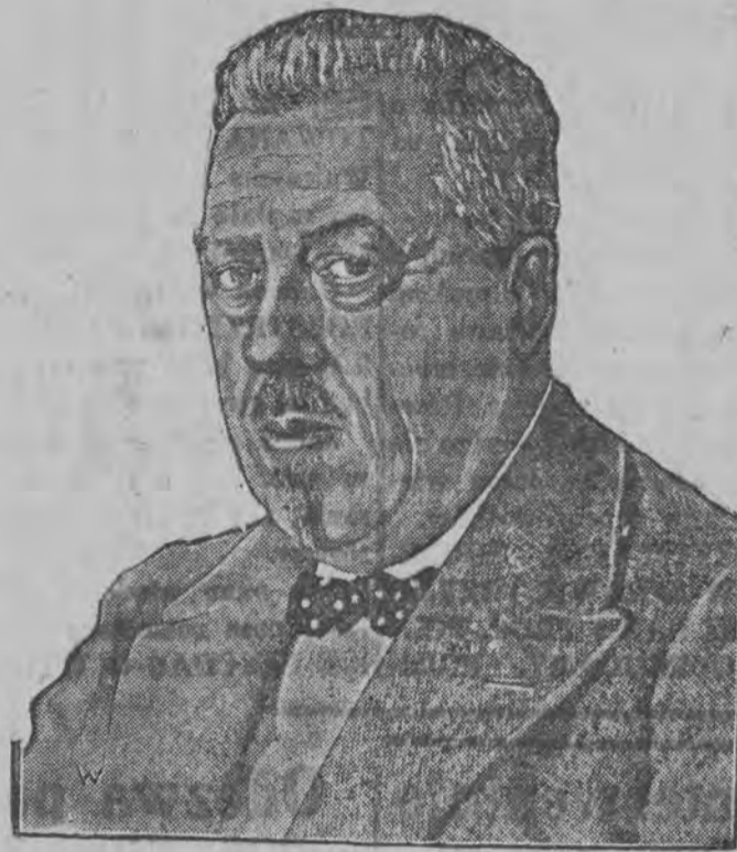
Komendant sterowca dr. Eckener

BERLIN, 15 października. (Pat.) „Berliner Zeitung am Mittag“ podaje z Nowego Jorku, że Karol von Wiegand donosi do „New York American“ w poniedziałek o godz. 6 m. 20 (czas środkowo europejski) iż sterowiec „Zeppelin“ o godz. 6 znajdował się w odległości 150 mil od wysp Bermudzkich i leciał w kierunku przylądka Hatteras. Uszkodzenia u steru zostały prowizorycznie naprawione, tak, że sterowiec prawdopodobnie w poniedziałek w południe lub najpóźniej popołudniu będzie mógł przybyć do Lakehurst. Von Wiegand nie podaje szybkości, z jaką sterowiec posuwa się naprzód. Według obliczeń redakcji „New York American“, szybkość lotu wynosić ma około 35 mil na godzinę. Dr. Eckener potwierdza wiadomość Wieganda w radjogramie, wysłanym do komendy portowej w Waszyngtonie. „Berliner Zeitung am Mittag“ podaje o locie następujące szczegóły: