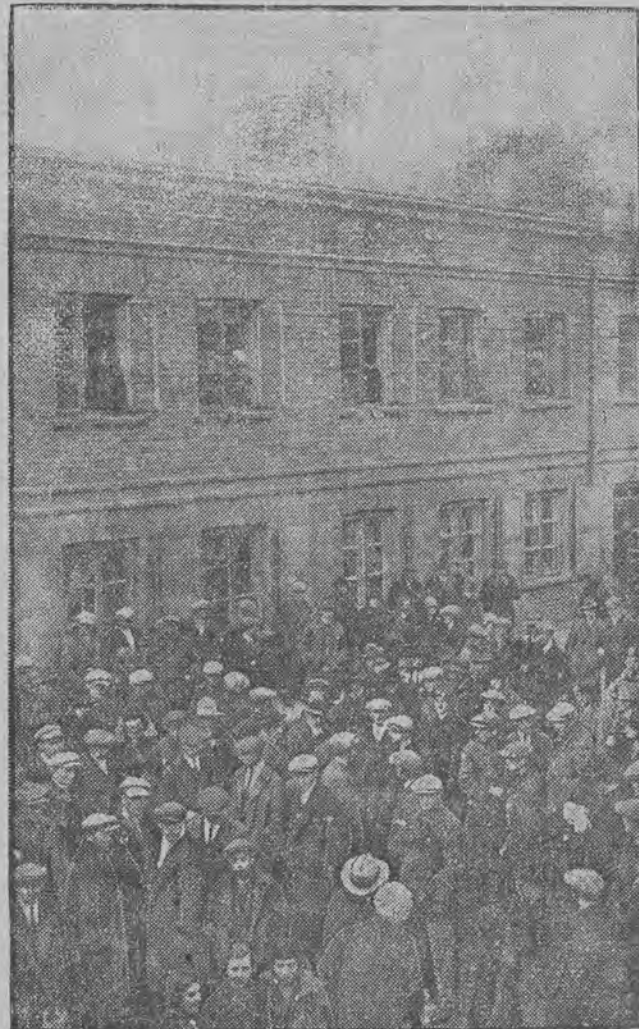
Od wtorku 16 b. m. wybuchł w Kaliszu strejk, który objął elektrownię miejską, robotników budowlanych, transportowych oraz częściowo tamtejszą pluszownię. Na ilustracji naszej widzimy robotników zgromadzonych przed domem związków zawod. w czasie gdy w lokalu związku na I piętrze odbywa się wiec strejkujących.

Po dłuższej dyskusji nad referatem zebrani delegaci uchwaili: strejk prowadzić w dalszym ciągu i baczyć, aby nie uległ on, jakiegokolwiek zmianie. (b)