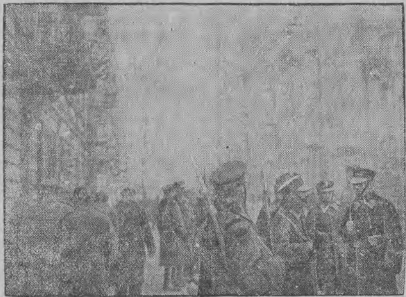
Silne patrole policyjne przed gmachem okręgowej komisji związków zawodowych przy ul. Narutowicza.

W dniu jutrzejszym rozstrzygną się ostatecznie dalsze losy zatargu