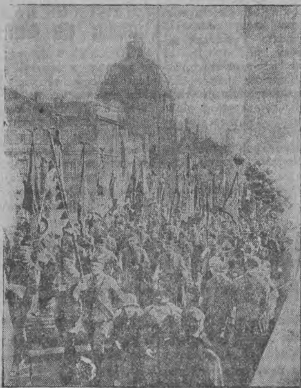
W Pradze czeskiej zakończyły się już wielkie uroczystości z racji dziesięciolecia niepodległości Republiki Czech i Słowacji. Święto miało charakter imponujący. Ilustracja nasza przedstawia fragment tego święta — wielki pochód sokolów, którzy zjechali się na uroczystości ze sztabami ze wszystkich stron republiki.