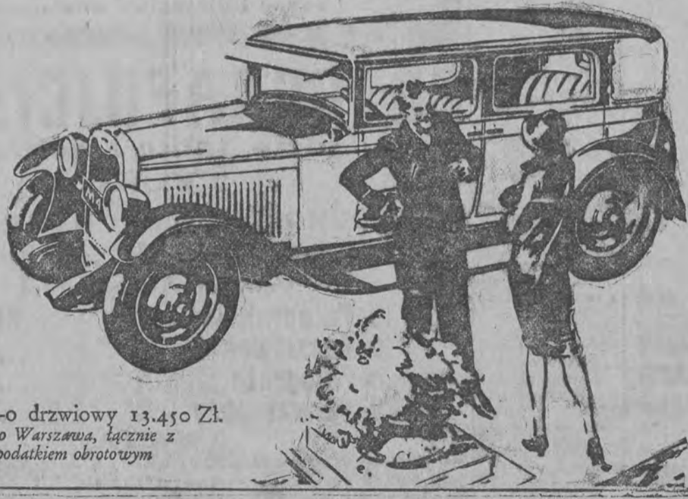
Sedan 4-o drzwiowy 13.450 Zł. Loco Warszawa, łącznie z podatkiem obrotowym