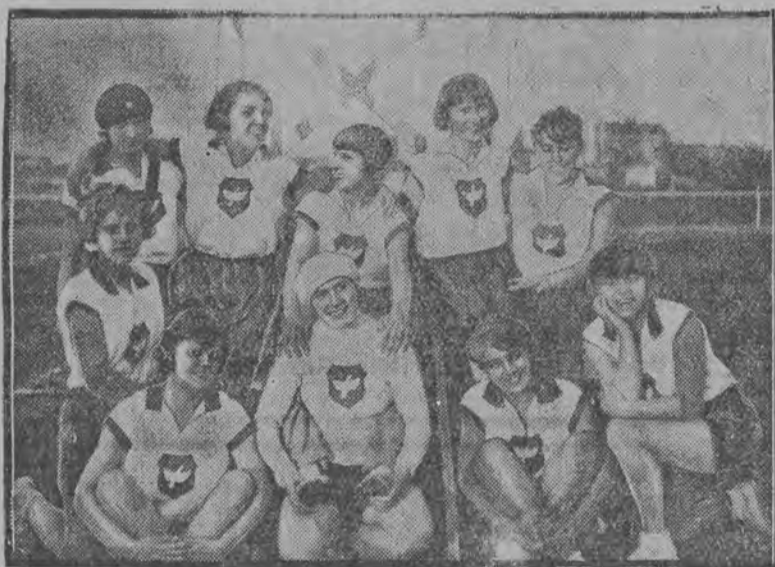
odniosły szereg sukcesów.