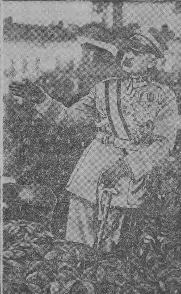
Marszałek w listopadzie 1928 r. na rewji na Polu Mokotowskim.