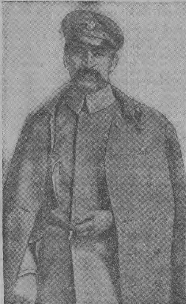
Komendant w roku 1918 po powrocie z więzienia Magdeburgskiego.