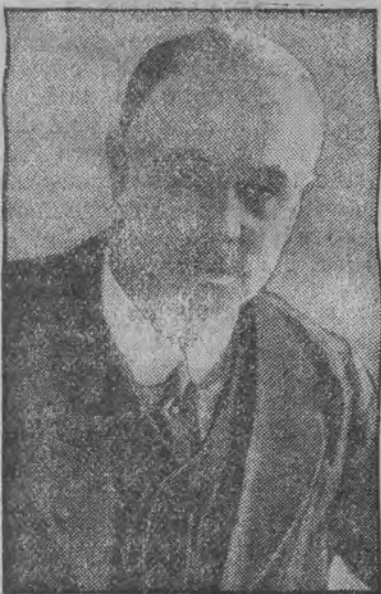
Sir James Eric Drummond

Wobec takiej rozbieżności w poglądach klubów, które niedawno zawarły związek, niewiadomo jak wypadnie dzisiejsze głosowanie. Zwracamy uwagę, że związek — P. P. S., „Wyzwolenie“ i stronnictwo chłopskie — miał na celu sprawy polityczne — obronę demokracji i parlamentaryzmu, a nie sprawy gospodarcze, wobec tego możliwe jest, że każdy z tych trzech klubów będzie dziś głosować inaczej.