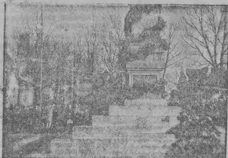
odslonięty w Wołkowysku w czasie uroczystości niepodległościowych.