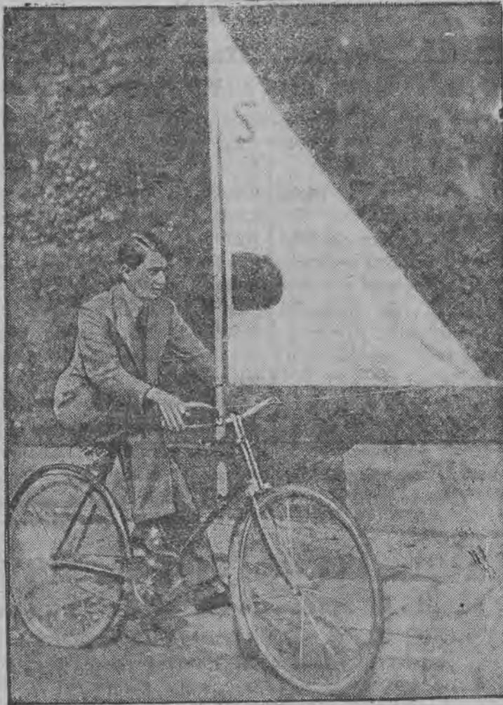
Zagłowiec na dwu kołach