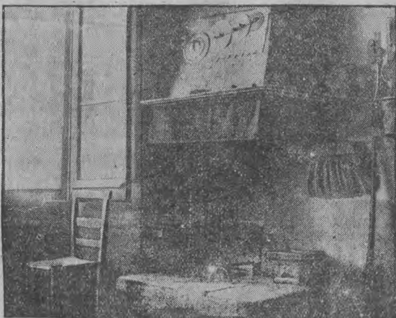
W tej izbie stała kołyska Mussoliniego.