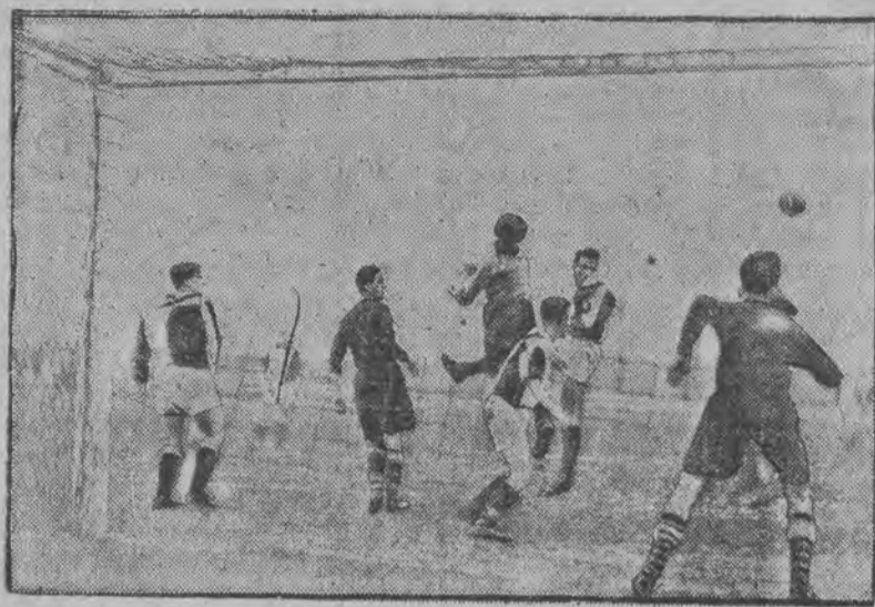
Moment z meczu o mistrzostwo ligi, który zakończył się zwycię- stwem drużyny warszawskiej w stosunku 3:2.