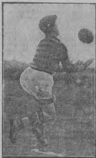
Bohater wczorajszych zawodów bramkarz Ł. K. S.-u Mila

U gości krakowskich wielkie poruszenie. Nikt się nie spodzie-