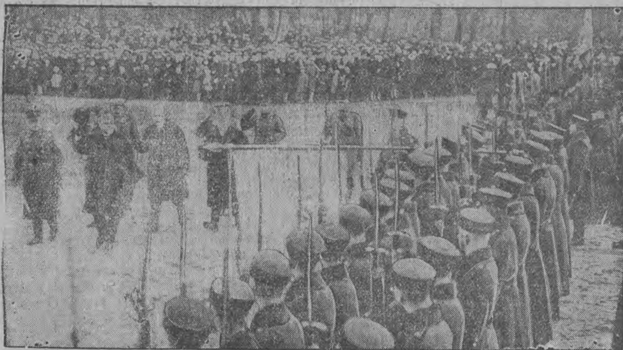
Prezydent państwa przed frontem wojsk łotewskich podczas rewji w dniu święta niepodległości