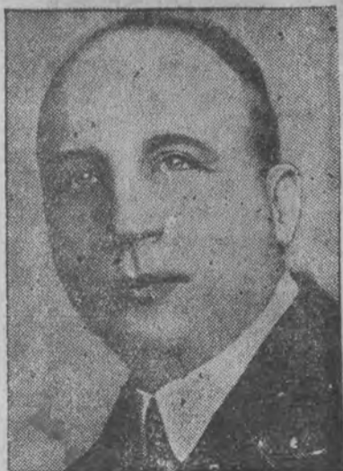
Ludwik Valko węgierski minister spraw zagranicznych.

WARSZAWA, 30 listopada. — (PAT.) — Dziś o godz. 5 popoł. w ministerstwie spraw zagranicznych odbyło się podpisanie polsko-węgierskiego traktatu kon-