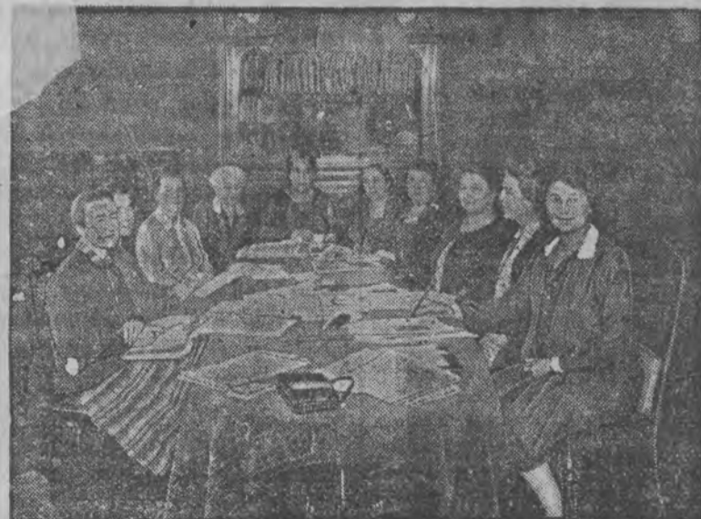
Konferencja międzynarodowego związku równouprawnienia kobiet.

Celem przygotowania tej uroczystości oraz kongresu odbyła się w Berlinie w gmachu parlamentu międzynarodowa konferencja przedstawicielek grup narodowościowych. Na załączonej ilustracji zajmują miejsca od strony lewej ku prawej: