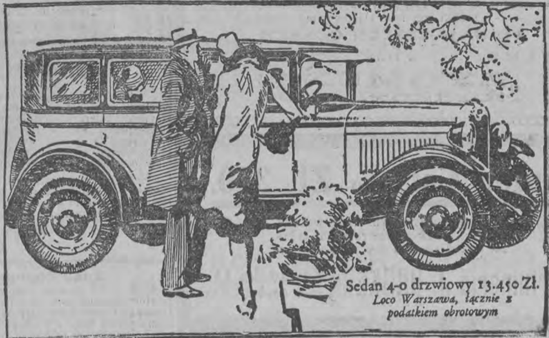
Sedan 4-o drzwiowy 13.450 Zł. Loco Warszawa, łącznie z podatkiem obrotowym

lekarzy specjalistów i Gabinet Dentystyczny ul. Piotrkowska № 62 tel. 31-53. Wszystkie specjalności. Lampy kwarcowe. Elektryzacja. Roentgen. Analizy. Wizyty na miesiąc.