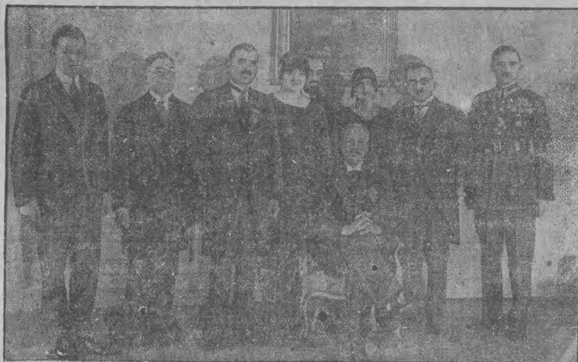
Pan Prezydent Rzeczypospolitej wraz z delegacją Związku Narodowego Polskiego w Ameryce, którą przyjął na Zamku na specjalnej audjencji

Choroby dzieci Południowa 9, tel. 23-70 przyjmuje od 5-5 pp