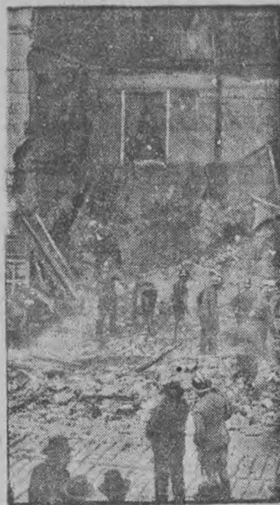
Dom, który się rozłupał.

Na pociechę naszym pesymistom, pomstującym, że czasem u nas zawali się dach, nieodnawiany od lat, podamy dzisiaj powyższą ilustrację. Przedstawia ona dom w Wiedniu przy ul. Alserbachstrasse nr. 75, obok którego przed paru dniami odbyła się uroczystość ku czci Schuberta, przed wystawioną tam ku jego uczczeniu fontanną. Dom ten nie był nawet zamieszkały, gdyż świeżo go odrestaurowano, widocznie jednak coś zaniedbano, gdyż nagle ściana frontowa, począwszy od drugiego piętra do dołu. Dom był staruszkim, bo liczył ponad 100 lat istnienia i właśnie w roku jubileuszowym zebrało mu się na taki figiel, żeby, jak ów djabeł Lesage'a odsłonił niedyskretnie wnętrza siedzib mieszkańców tego figlarnego domu.