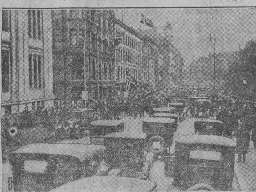
Dwie minuty milczenia na głównej ulicy w Oslo.