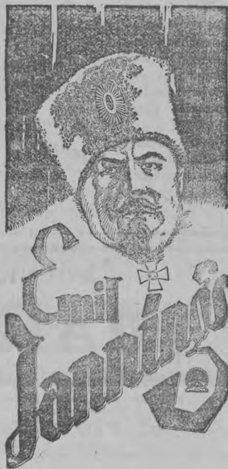
Jannings w filmie „Ostatni Rozkaz“.