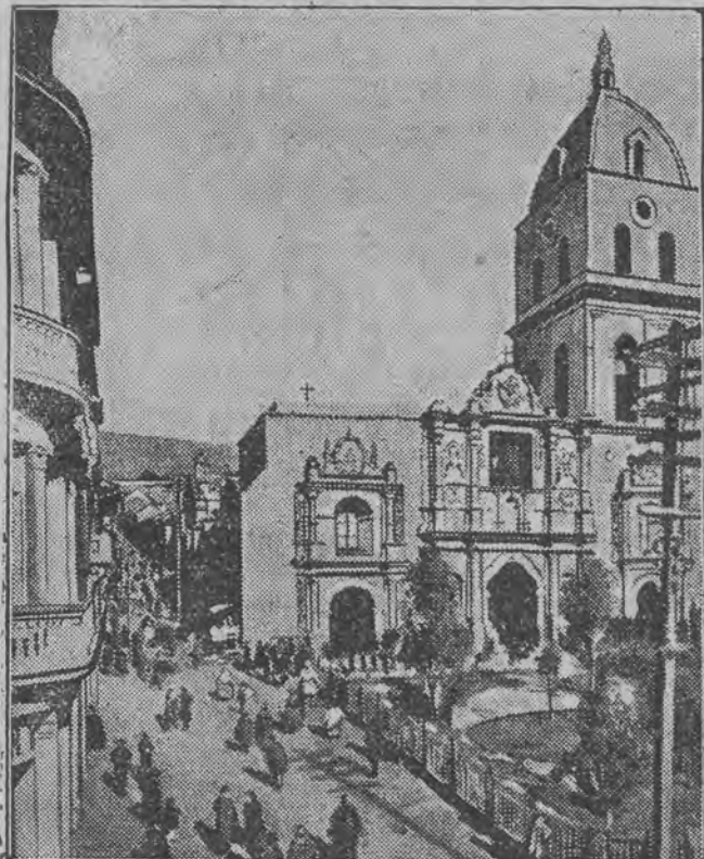
W katedrze San Francisco w La Paz, stolicy Boliwii, odprawiane są modły o zwycięstwo nad paragwajskim wrogiem