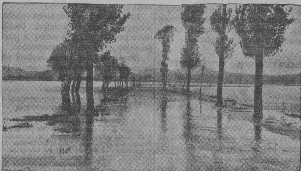
Ostatnio Mozela wystąpiła z brzegów. Niżej położone miejscowości stoją pod wodą