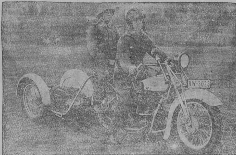
Nowa broń Reichswehry — karabin maszynowy na motocyklu.