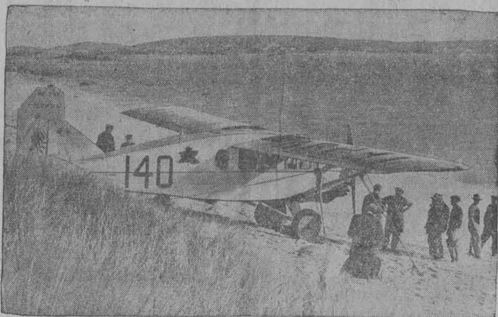
Samolot „Columbia”, na którym bohaterscy lotnicy Boyd i Connor przelecieli z Ameryki do Anglii.

Zaznaczyć należy, że ś. p. Sieja za 2 tygodnie miał wstąpić w związki małżeńskie, do czego już wszystko było przygotowane. Zamiast jednak wesela, odbędzie się smutny obrzęd pogrzebowy obłubieńca.