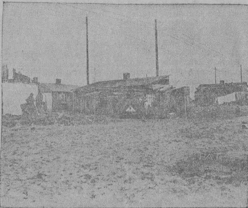
Kilka tysięcy robotników portowych w Gdyni mieszkało dotychczas w drewnianych budach, w przerażających warunkach higienicznych.