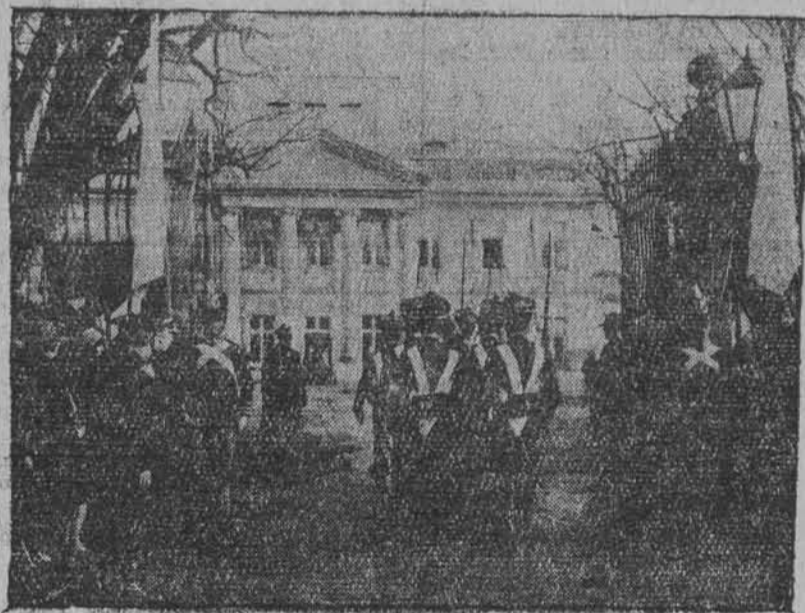
Zaciągnięcie historycznej warty przed pałacem Belwederskim. —

W SETNĄ ROCZNICĘ POWS TANIA LISTOPADOWEGO.