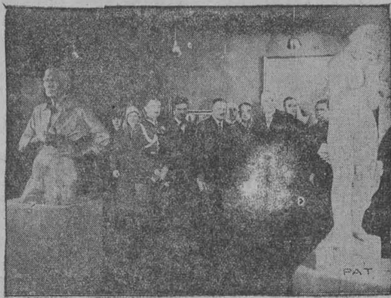
W dn. 29 listopada w Kamienicy Baryczków Pan Prezydent Rzplitej dokonał otwarcia „Wystawy Listopadowej”.