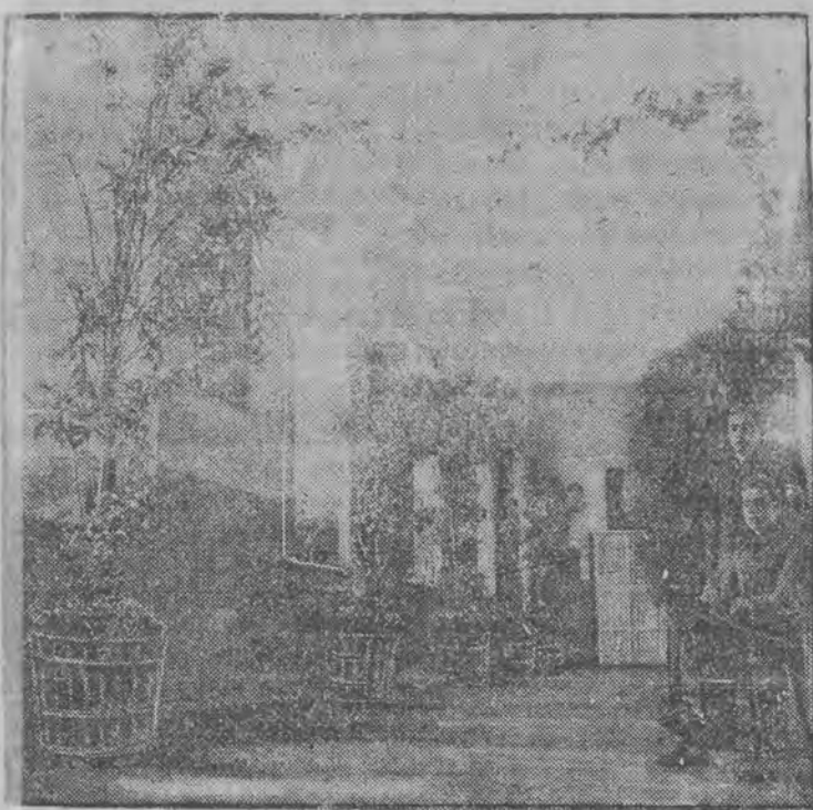
Kurytarze gimnazjum w Zamościu — cieplarnia.

Ktoś sądził, że torowanie nowych dróg w szkolnictwie odbywa się jedynie w większych ośrodkach życia. myliłby się bardzo. Prowincja nietylko nie pozostaje w tyle, ale przeciwnie: w wielu wypadkach usiłuje z widocznymi rezultatami wysuwać się na czoło pochodu, dążącego po nowe zdobycze.