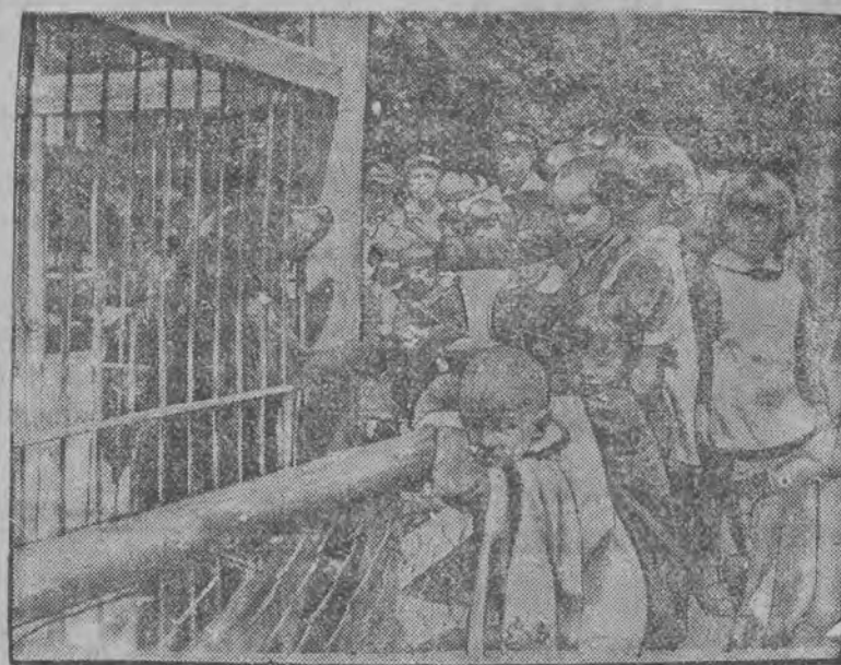
Z ogrodu szkolnego.

Tak więc wierny dawnym tradycjom Zamość — choć jest jedynie małym prowincjonalnym miastem — godnie spełnia swą piękną kulturalną misję.