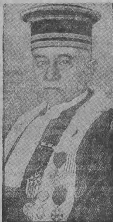
b. prokurator sądu w Kolmarze, na którego dokonali zamachu autonomiści alzaccy.