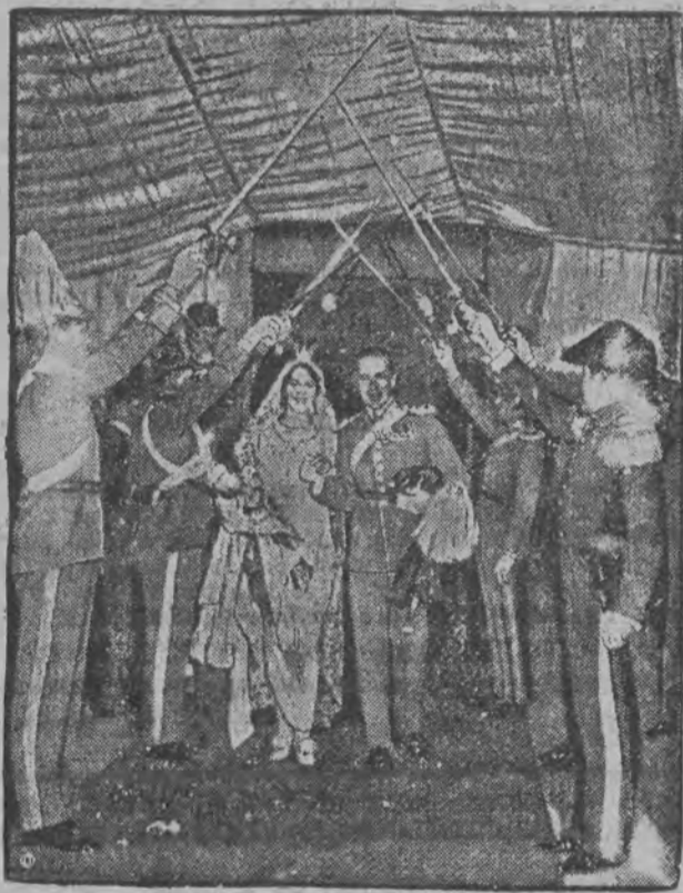
W chwilę po ślubie