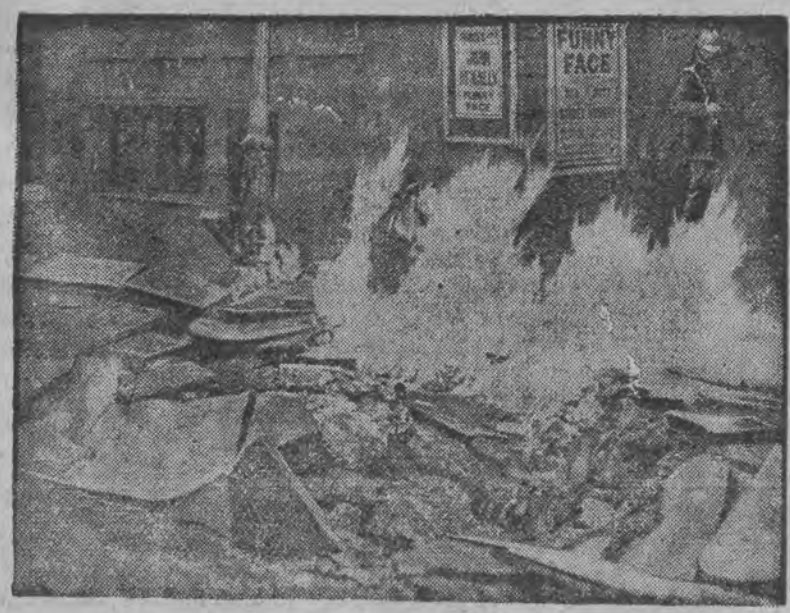
Płomienie buchające z pod bruku ulicy Shaftesbury Avenue pod gmachem teatralnym.

Mieszkańcy Londynu przeżyli ostatnio dni silnej emocji. Wybuchy rur gazowych i wślad za tem ukazujące się ogniste języki nad powierzchnią ulic sprawiały niesamowite wrażenie. W ciągu dwudni płonęły formalnie ulice Nowego Oxfordu, Hay i Danemark. Załączone obok ilustracje przedstawiają fragmenty katastrofalnej eksplozji.