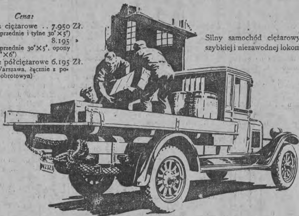
Silny samochód ciężarowy do szybkiej i niezawodnej lokomocji

Cena: Podwozia ciężarowe . . 7.950 Zł. (Opony przednie i tylne 30" x 5") 8.195 (Opony przednie 30" x 5", opony tylne 32" x 6") Podwozie półciężarowe 6.195 Zł. (Loco Warszawa, łącznie z po- datkiem obrotowym)