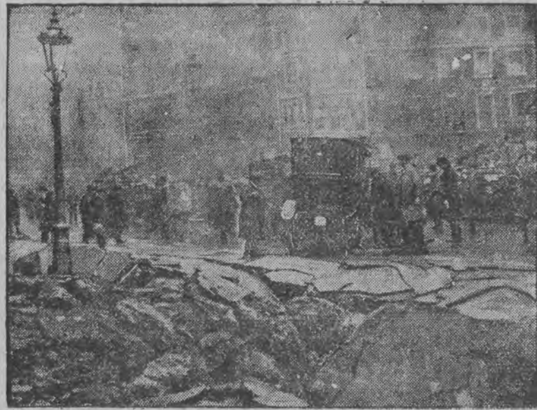
Porozwalane lezdnie i chodniki w centrum Londynu.