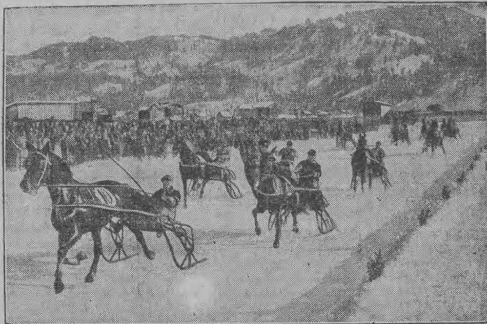
Bieg otwarcia w Garmisch — Partenkirchen na saniach jednokonnym.