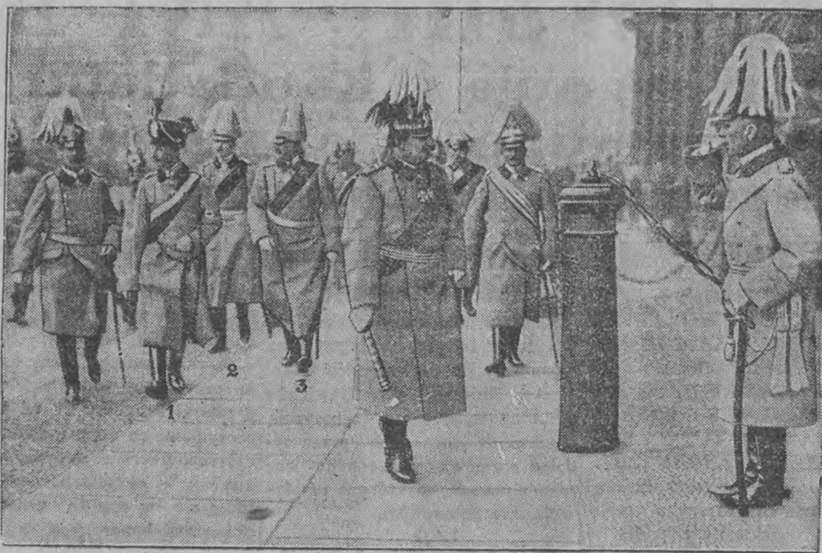
Obrazek z przedwojennych czasów: kajzer Wilhelm udaje się ze swymi synami do zbrojowni na ilustrację (1. kronprinz, 2. ks. August Wilhelm, 3. ks. Eitel Fryderyk).