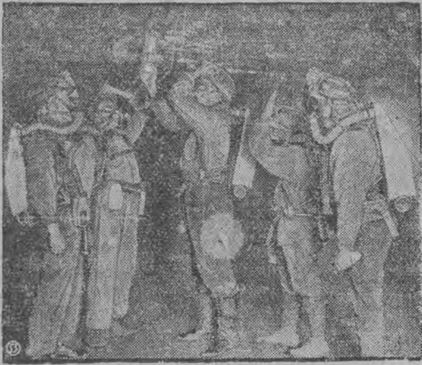
Pogotowie ratunkowe, badające wnętrze kopalni.