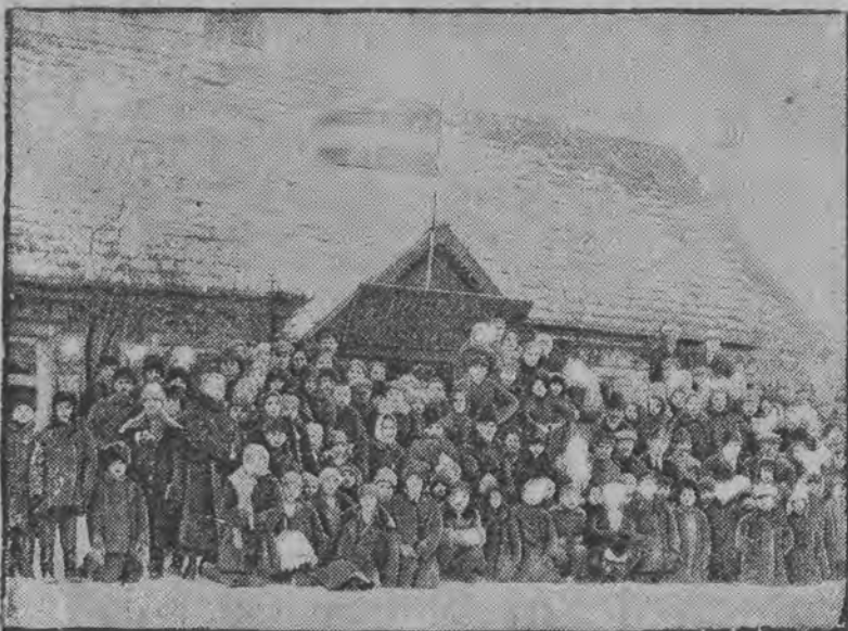
Uczennice i uczniowie polskiej szkoły w Dynenburgu z nauczycielką pośrodku.