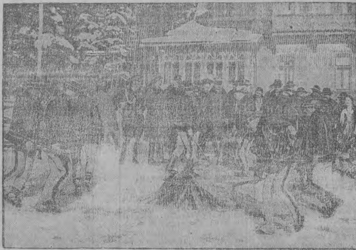
Górale w malowniczych swych strojach tańczą przed Panem Prezydentem Rzeczypospolitej piękny zbójnicki taniec