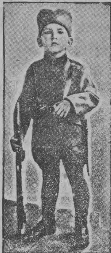
Starszy syn króla Aleksandra księcia Serbii, następca tronu i przyszły król Jugosławii, w mundurze żołnierza serbskiego, fotografowany w tylnych dachach