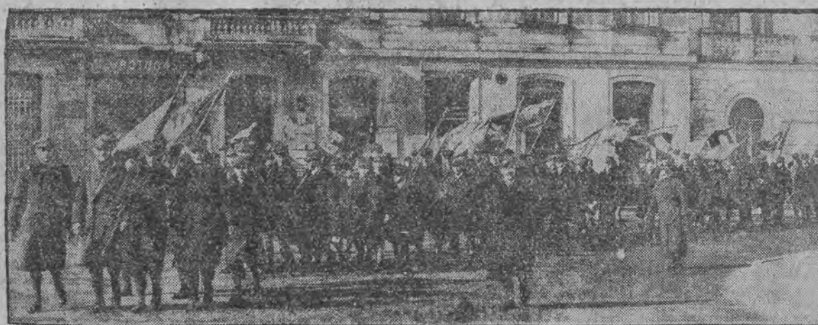
W ubiegłą niedzielę odbył się w Warszawie 8 zjazd delegatów oddziału warszawskiego zw. harcerstwa polskiego. Obrady zjazdu, prowadzone w sali Centr. Tow. Rolniczego przy ul. Kopernika 30, poprzedziła msza w kościele św. Antoniego, skąd delegaci w kolumnie ze sztandarami przeszli na posiedzenie zjazdu, jak ich widzimy, w marszu przez Plac Małachowski.