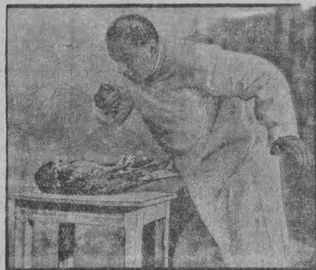
Wielkie zainteresowanie w świecie naukowym wzbudza eksperymenty słynnego hipnotyzera dr. Hannussena, który przebywa obecnie w Wiedniu. Hannussen na publicznych seansach wprowadza w silny trans hipnotyczny najrozmaitsze zwierzęta.