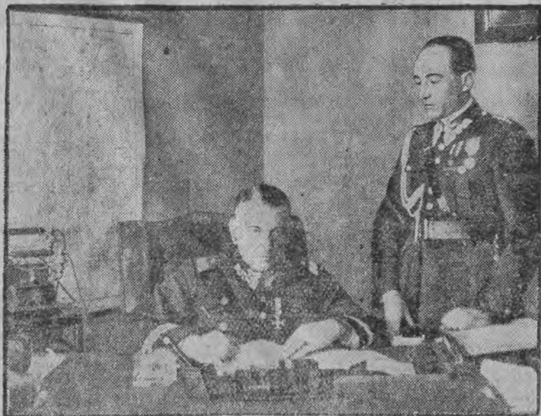
Wiceminister gen. Fabrycy ze swym adiutantem rtm. Iwanowskim przy pracy.