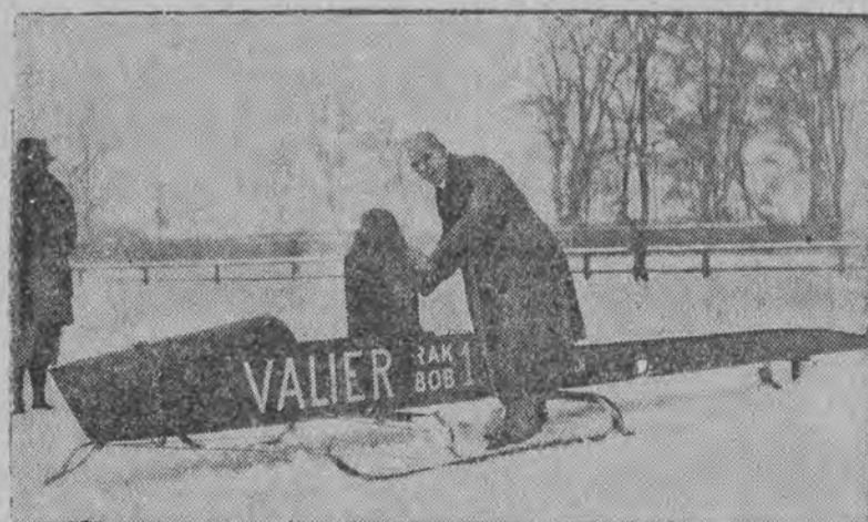
Inżynier Max Valier skonstruował pierwsze sanie raketowe, które widzimy na naszej ilustracji. Sanie te osiągnąć mogą szybkość wprost zawrotną.