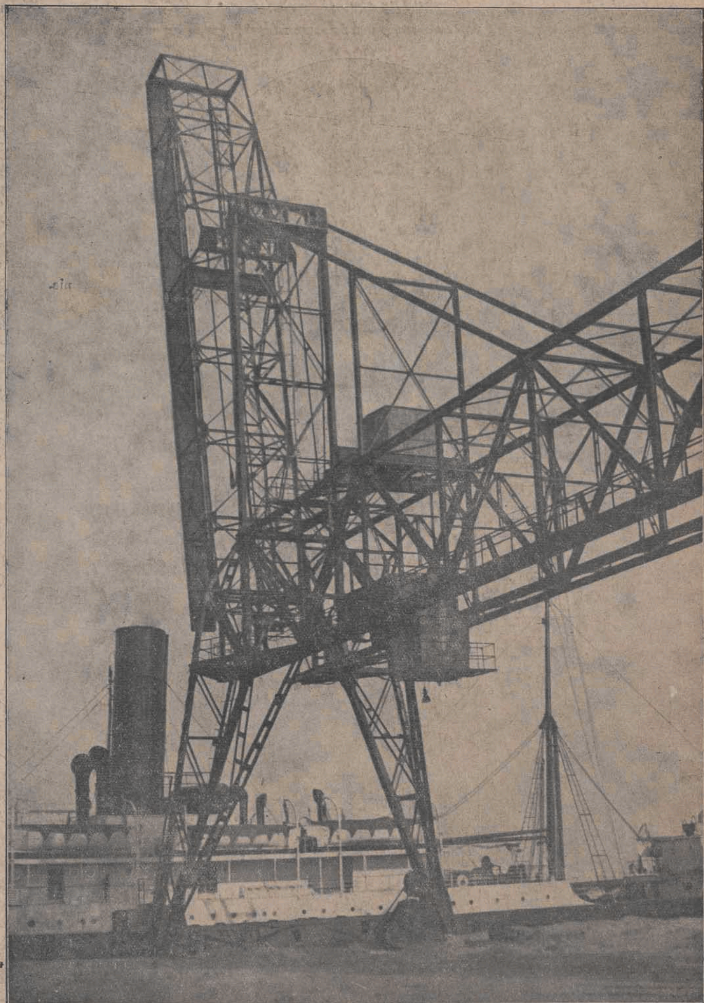
Nowa dźwignia mechaniczna w Gdyni.