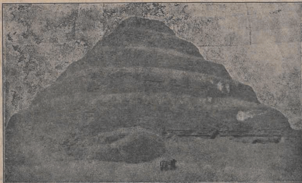
Święta góra w Kadyr (Turkiestan).