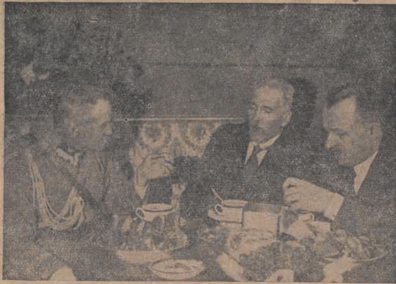
Narada p. Prezydenta Mościckiego z marsz. Piłsudskim i wicepremierem Bartlem nad dalszemi losami Sejmu.