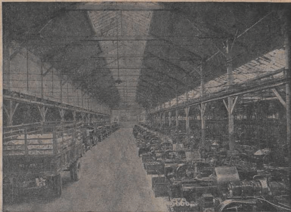
Wielka sala maszyn w fabryce „Citroen“ w Paryżu.