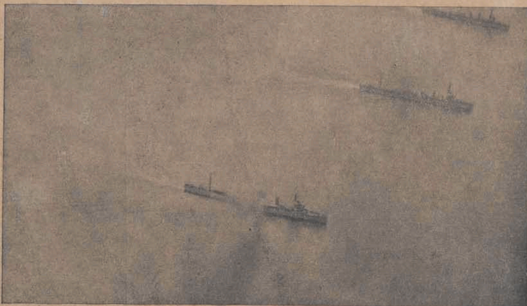
Manewry kanonierek polskich u brzegów Helu.