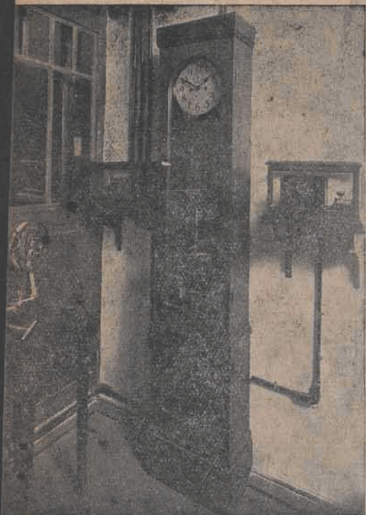
Automatyczne zegary na dworcu w Warszawie.