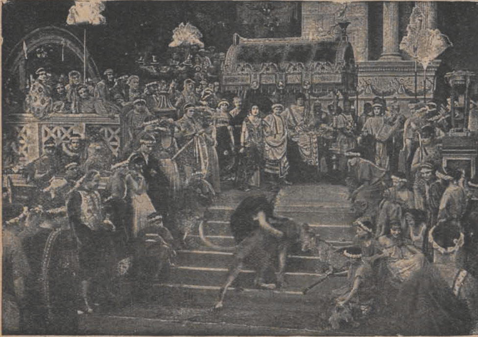
Scena w pałacu Nerona.