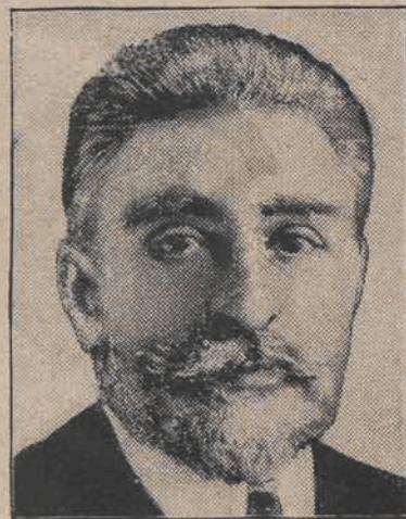
Premjer rumuński Brătianu, przeciwnik ks. Karola.