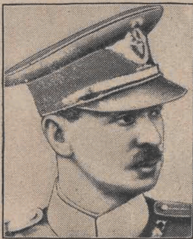
B. następca tronu, ks. Karol marzy o tronie rumuńskim.

Sześćcioletni król Michał z babką, królową Marią.