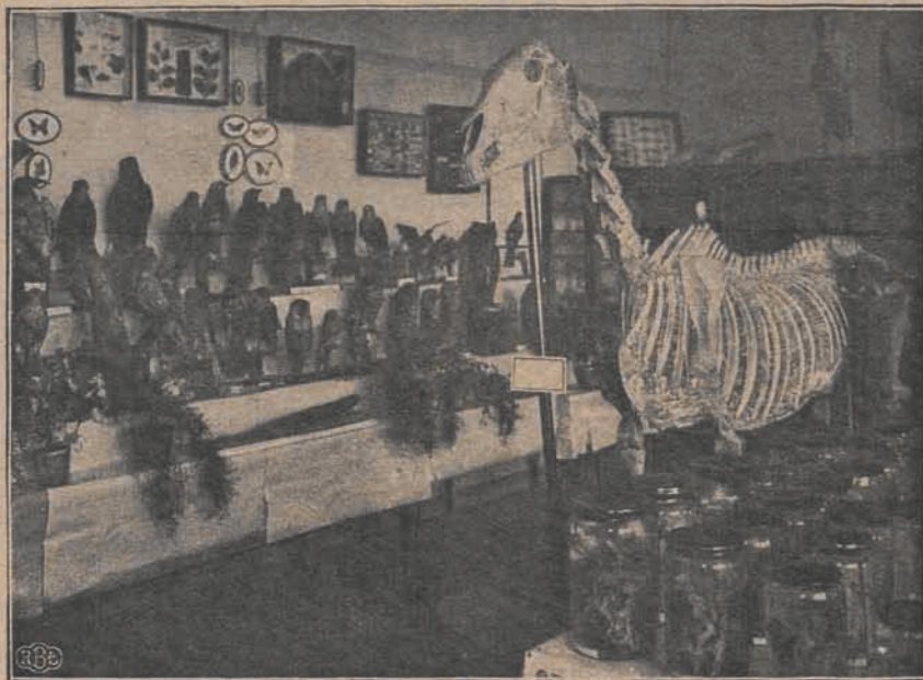
Fragment sali z wypchanymi ptakami.