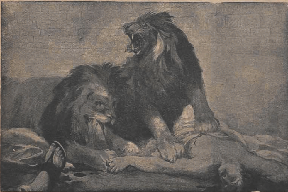
Krwawe igrzyska rzymskie.