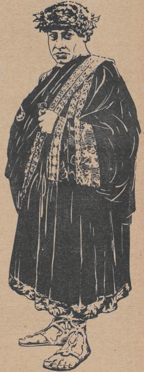
Krwawy cesarz Rzymu NERON (Emil Jannings).