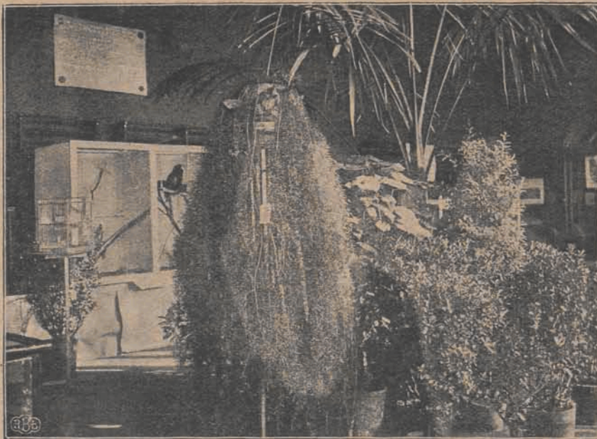
Fragment sali z roślinami egzotycznymi. W środku Asparagus o lodygach długości 2.50 m.