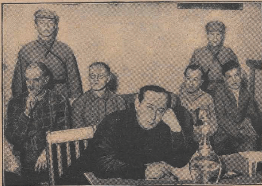
Zdjęcie nasze przedstawia 4 skazanych, przez bolszewicki sąd, na karę śmierci przez rozstrzelanie za szpiegostwo na rzecz Anglii. Na pierwszym miejscu siedzi obrońca.