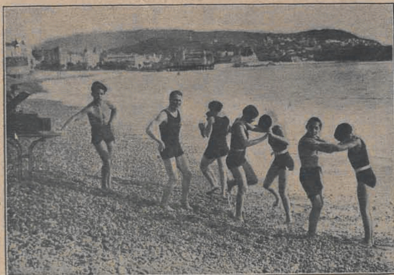
W styczniu r. b., na plaży w Nicei: przy dźwiękach patefonu, w kostjumach kąpielowych, charleston nad brzegiem morza... w niewielkiej odległości od mroźnej i śnieżnej zimy europejskiej.