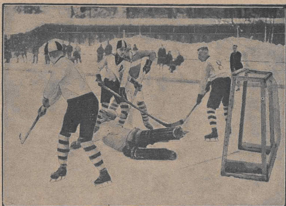
Fragment z rozgrywek hokejowych na lodzie.