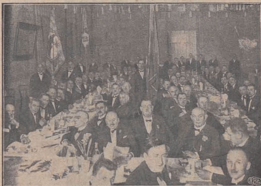
Zdjęcie z bankietu, w którym brali udział członkowie Cechu i zaproszeni goście.