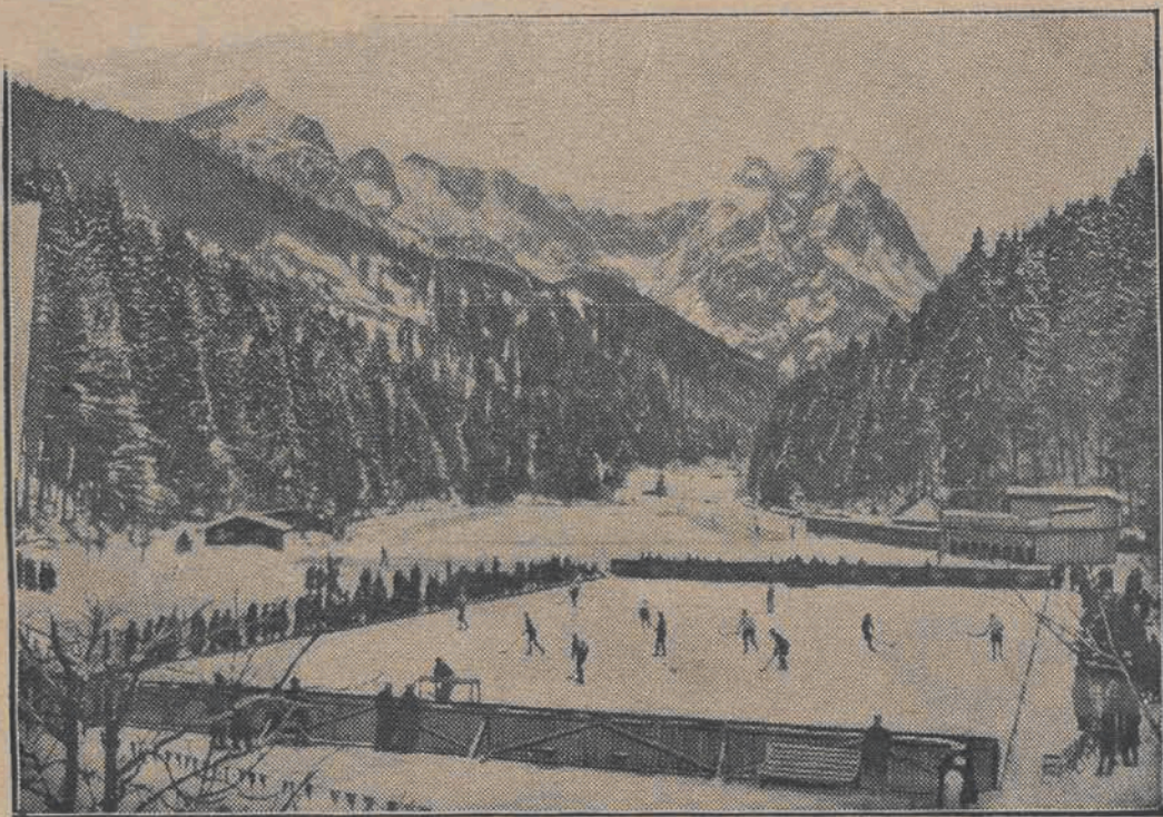
Boisko hokejowe w pięknie położonej kotlinie górskiej.