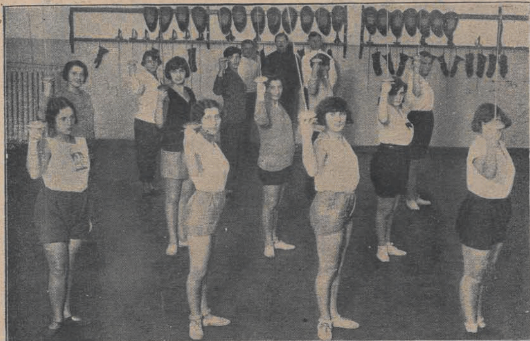
Kobieca zaprawa szermiercza w ośrodku w. f. w Warszawie] pod kierunkiem Węgra Szombathelego