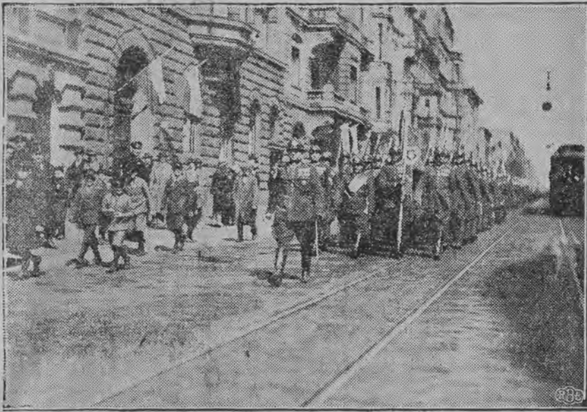
Defilada oddziałów garnizonu łódzkiego przed dowódcą O.K. IV gen. Małachowskim. Dziarska postawa żołnierzy wzbudziła olbrzymi entuzjazm wśród publiczności, która witała defilujące oddziały huraganem oklasków.