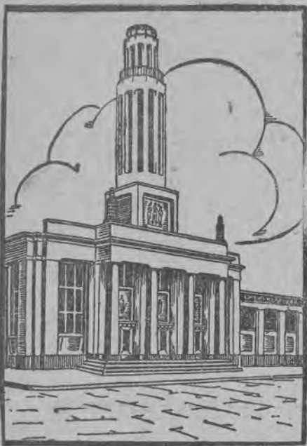
Westibulum Reprezentacyjny P.W.K.

Jak wiadomo, Polska poza mniejszymi imprezami wystawowymi, większych wystaw nie urządzała, wskutek czego nie ma też odpowiedniej literatury (nie wyłączając lwowskiej wystawy w r. 1894), z której można by czerpać wskazówki. Nie mamy też tradycji wystawowej. Z konieczności przeto musieliśmy oprzeć się na literaturze zagranicznej bardzo zresztą bogatej i doświadczenia obcych wystaw przystosowywać umiejętnie do specjalnych warunków polskich.