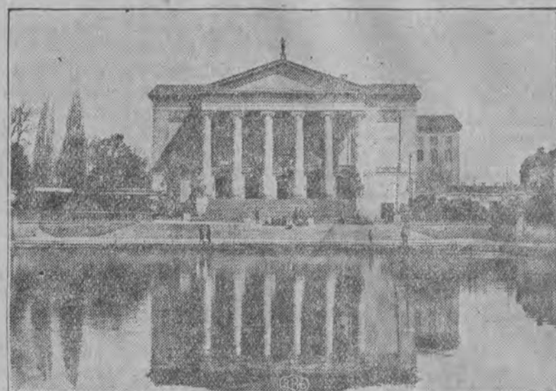
Poznań — Gmach Opery.

P. W. K. była organizacją poprostu niezbędną dla naszego życia gospodarczego tak niezbędną jak bilans, a zarazem szyld dla poszczególnego przedsiębiorstwa. O propagandzie polskiej zagranicą mówi i pisze się wiele; pochłania ona, rokrocznie znaczne kwoty rezultaty jej są dotąd nikłe. Dość wspomnieć o takich przykładach jak pospolite w Szwecji pokrywanie terytorjum Polski na mapie Europy plamą tu-