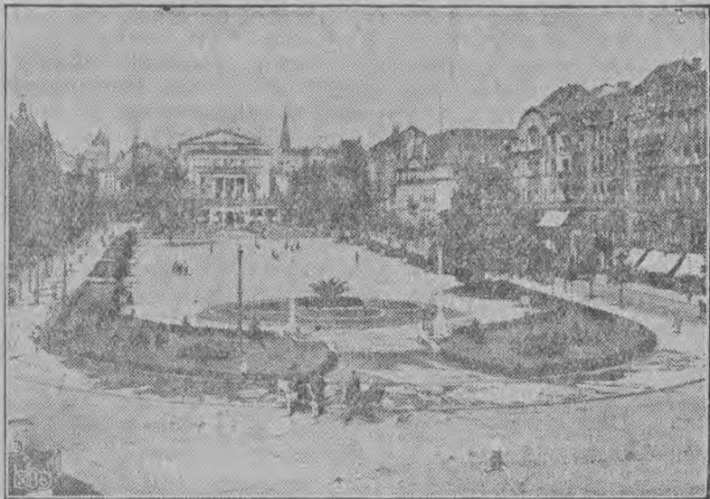
Poznań — Plac Wolności.

Łódź na Poznań. Warsztat pracy, to bodaj że najciekawszej, jakim jest Łódź, nie nadawał się do podjęcia tej roli trudnej i wymagającej estetycznego wykończenia — jak P. W. K. Na rubieży zachodniej, w prow-