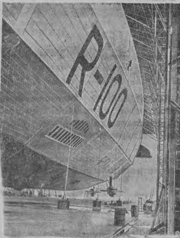
W Anglii został wykończony nowy olbrzym powietrzny R. 100, stanowiący statek tego samego typu, co R. 101. Obecnie dokonywa on lotów próbnych w porcie lotniczym w Howden Yorkshire