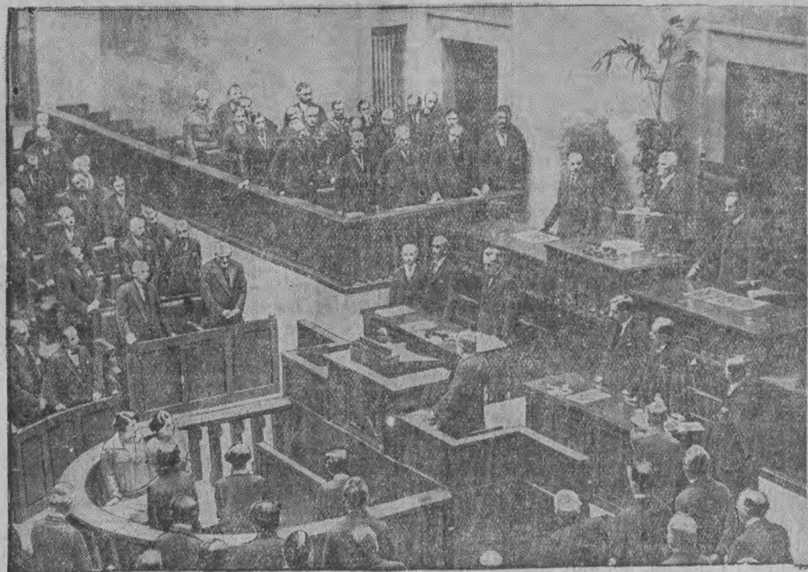
Na trybunie marszałkowskiej stoi marsz. Daszyński, którego przemówienie, poświęcone pamięci J. Clemenceau i zmarłych posłów sejmu wysłuchała izba stojąc.