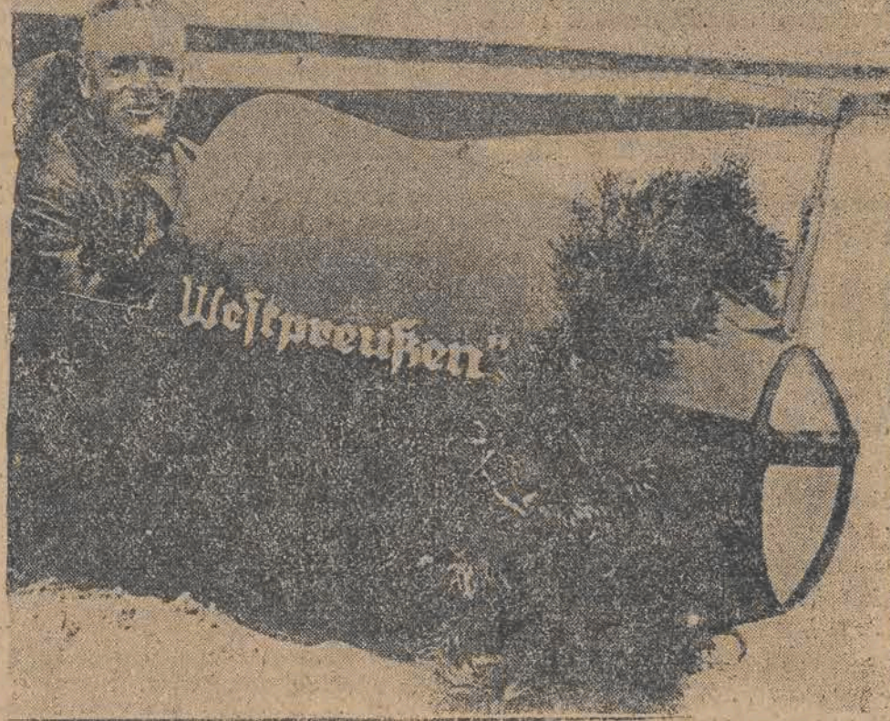
W powietrzu Rosjten w Niemczech. Lotnik Ferdynand Szule na samolocie bez motoru utrzymał się w powietrzu w ciągu 14 godzin i 7 minut, bijąc w ten sposób wszystkie rekordy świata.